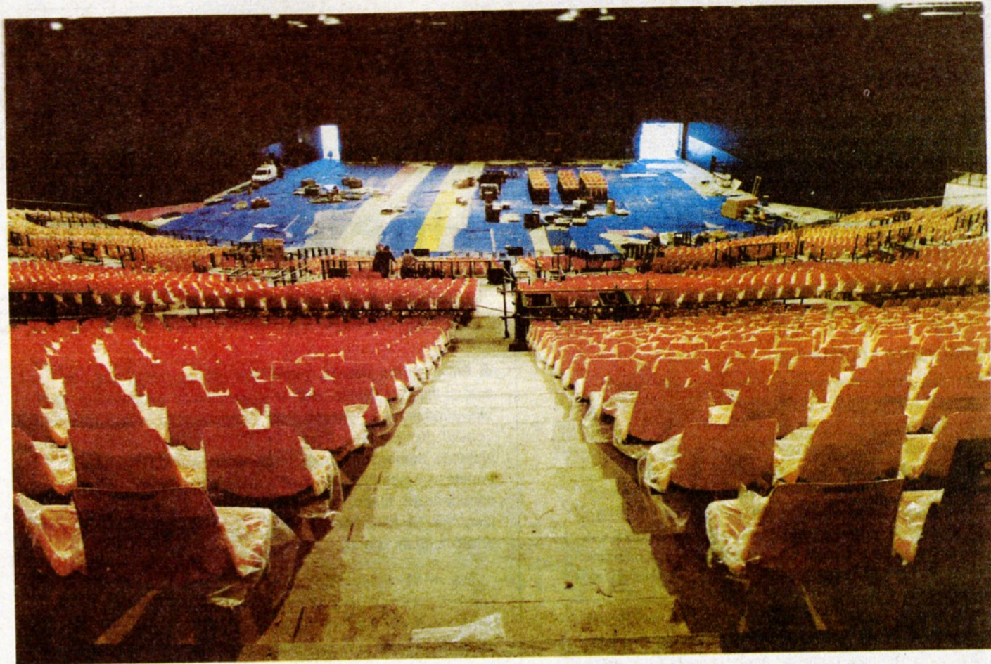
Dans les gradins, les sièges orange pourront accueillir jusqu'à 6300 personnes.

Dans la salle de spectacle – 6300 places assises en gra-