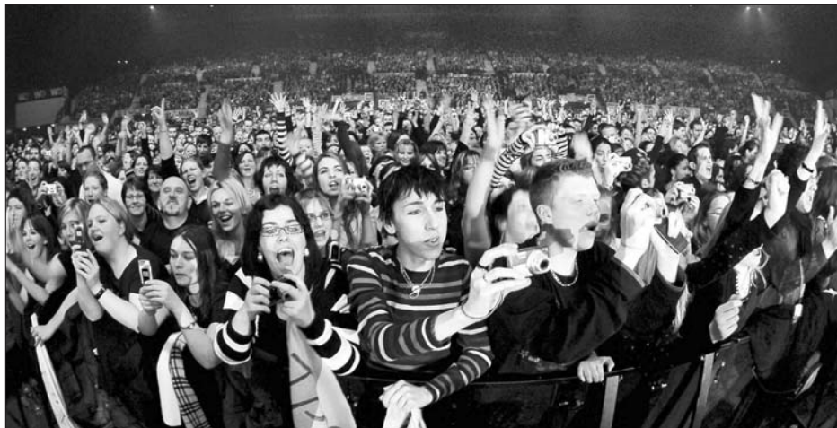
Le Zénith de Strasbourg ne devrait pas concurrencer celui de Nancy ou les Arènes de Metz, en revanche le Galaxie d'Annville, qui joue dans la même cure, pourrait éprouver des difficultés à soutenir la comparaison.

Comment va se positionner ce Zénith dit de l'Europe dans un secteur déjà particulièrement riche en lieux de spectacles.