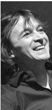
Cali foulera la scène du nouveau Zénith de Strasbourg en avril prochain.

STRASBOURG. 60.000 visiteurs pour les journées portes ouvertes des 5 et 6 janvier, 10.000 - jauge pleine - pour le premier spectacle, jeudi dernier, en attendant les sept prestations sold out en quelques heures des «Enfoirés» à la fin du mois, le quinzième des Zénith, le plus beau peut-être, ne pouvait espérer début plus populaire. Ces chiffres semblent souligner combien l'agglomération strasbourgeoise attendait depuis longtemps une telle réalisation. Jusqu'à ce début d'année 2008, la capitale de l'Europe avait dû se contenter du Hall Rhénus, parc des expositions recyclé, devenant ainsi un parent plus que pauvre de la grande galaxie des musiques modernes. Une situation particulièrement paradoxale pour cette ville au cœur du vieux continent où ont ébauché leur carrière des producteurs devenus des pointures nationales et même internationales, à commencer par Harry Lapp impliqué, depuis, dans la politique municipale après avoir occupé un siège de député.