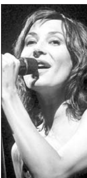
Zazie au nombre des artistes saluant la nouvelle réalisation.

Pour mémoire c'est à Limoges que Michel Polnareff avait choisi de répéter avant de s'installer à Bercy, là également qu'il a donné la première date de sa tournée.